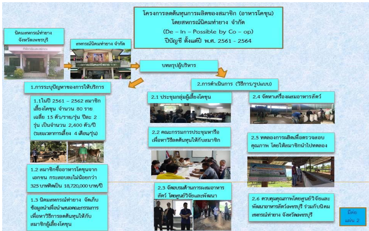
ภาพที่ 1 แผนผังการดำเนินโครงการโครงการลดต้นทุนการผลิตของสมาชิก ผ่าน สหกรณ์นิคมท่ายาง จำกัด (De - In - Possible by Co - op)