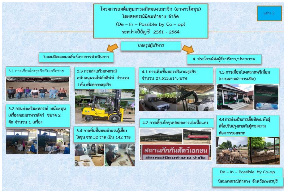
ภาพที่ 2 แผนผังการดำเนินโครงการโครงการลดต้นทุนการผลิตของสมาชิก ผ่าน สหกรณ์นิคมท่ายาง จำกัด (De - In - Possible by Co - op)